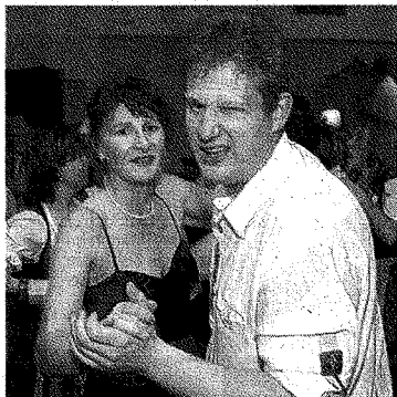
Trotz dichtem Gedränge auf der Tanzfläche war es kein Problem, ein Plätzchen zu finden.