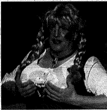
„Ratschkathl“ nahm den Mund (und nicht nur den) natürlich auch heuer wieder voll.

MAUTERNDORF (ako). Unglaublich, aber wahr! Das sollten die Geschichten nach Möglichkeit sein, um bei den traditionellen Faschingsitzungen in Mauterndorf noch einmal aufgegriffen und ausführlich erzählt zu werden. Von Ereignissen solcher Art wusste die Faschingsgilde einmal mehr genug zu berichten. Sorgen die Bürger von Mauterndorf mit