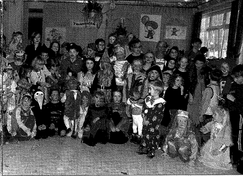
St. Michael gab es ein buntes Stelldichein verschiedener Masken.