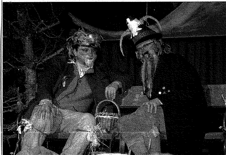
Der „Federnbachtl“ und der „Voitl“ machten sich auch heuer bei den zwei Faschingssitzungen in Mauterndorf so ihre Gedanken über Geschehnisse des vergangenen Jahres.

Ein kurzer, aber sehr intensiver Fasching ging im Lungau zu Ende. Im Mittelpunkt natürlich die Faschingshochburg Mauterndorf.