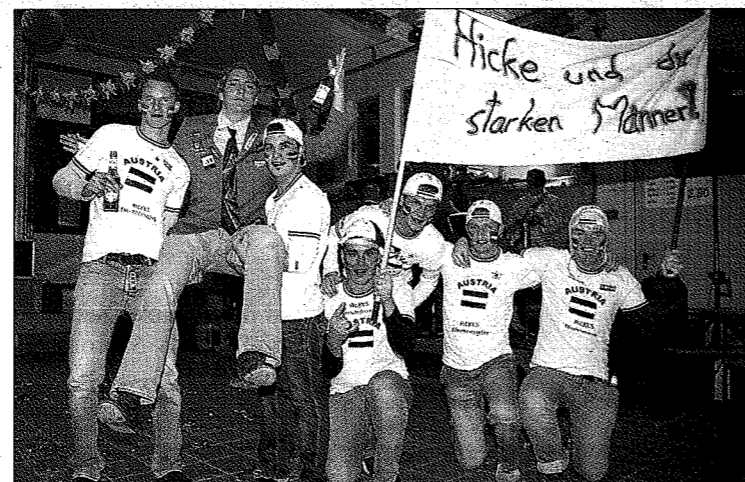
Die Mariapfarrer Fußballer präsentierten sich beim Maskenball im Hinblick auf die EM 2008 als „Hicke und die starken Männer“.