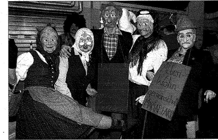
Beim Ball der Feuerwehr und Musikkapelle Mariapfarr war auch das Thema „Seniorenwohngemeinschaft“ aktueller denn je.