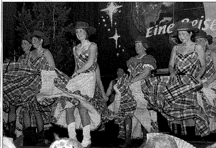
Sorgten wieder für Schwung und gute Stimmung mit ihren von Anna Bauer einstudierten Tanzeinlagen: die Tanzgirls.