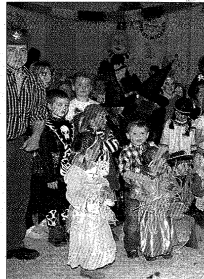
Beim Kindermaskenball des USK Judo

Mauterndorf war auch heuer wieder die Hochburg des närrischen Treibens im Lungau.